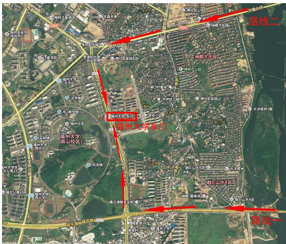
图1 由校外到福州大学东门的交通图